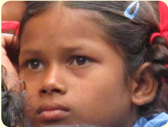
(Ein Kind, das in die Zukunft schauen kann, weil es eine hat)

Mit 22,- € pro Monat kann ein Kind für einen Monat mit Kleidung, Nahrung, Schulbildung und einer Unterkunft versorgt werden.